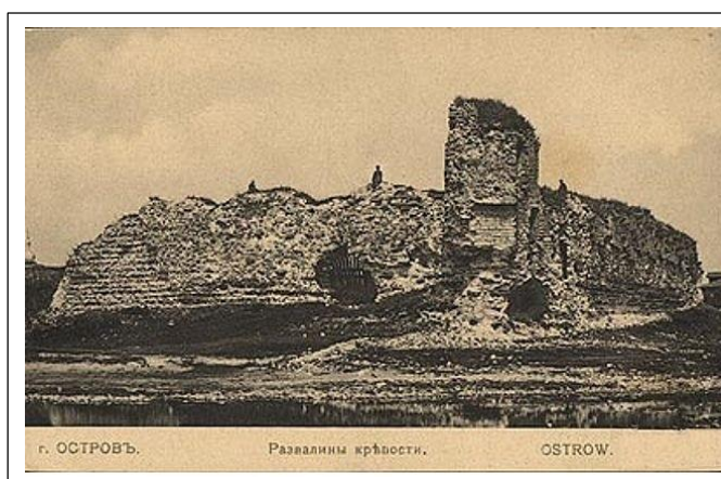
Г. ОСТРОВ. Развалины крепости.