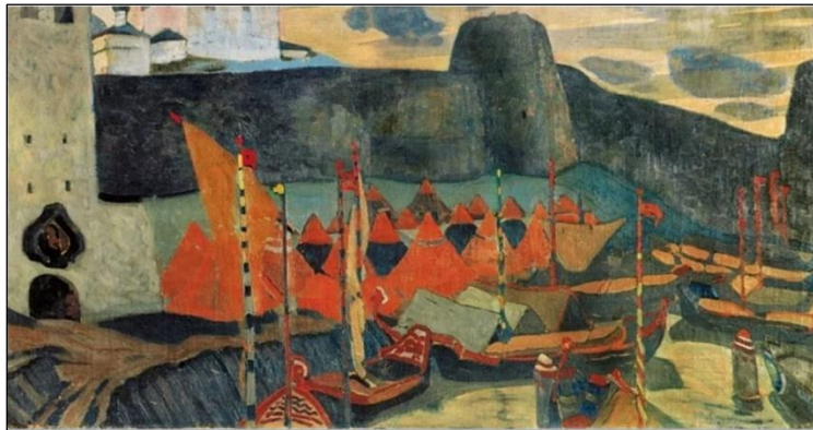
Н.К. Рерих. Старый Псков. 1904.