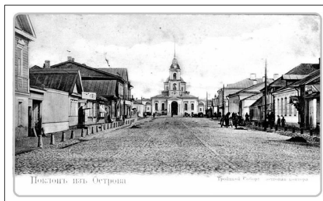
«Остров, древний псковский город... 1897 г....»