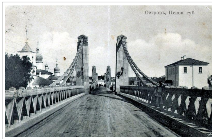
г. Остров. Псковская губерния.

Н.К. Рерих «Листы дневника», т. 2. М. 1995 г.