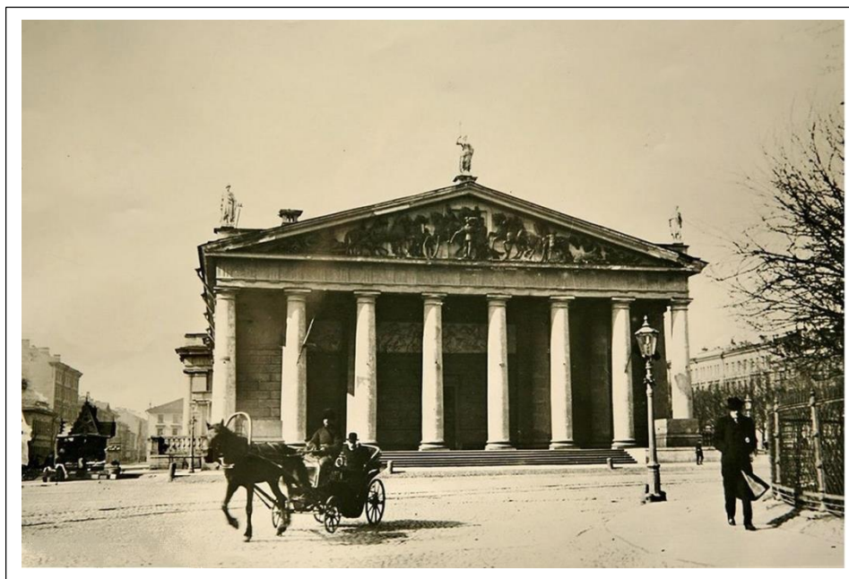
КОННОГВАРДЕЙСКИЙ МАНЕЖ. С.-Петербург. (Фотография начала 1900-х.)

Искусство и художественная промышленность. 1898. Октябрь-ноябрь. № 1-2.