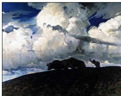
Ф. Рущиц. Земля. 1898.

«Последний снег» В. Пурвита, «Сумерки» В. Зарубина,