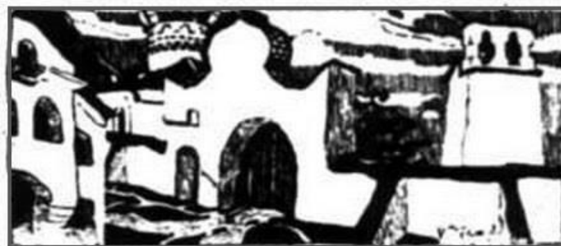
Н.К. Рерих. Псковский погост. Заставка.